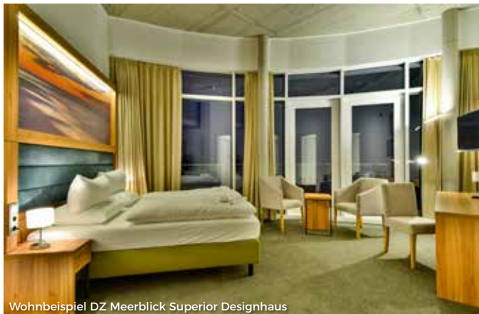
Wohnbeispiel DZ Meerblick Superior Designhaus