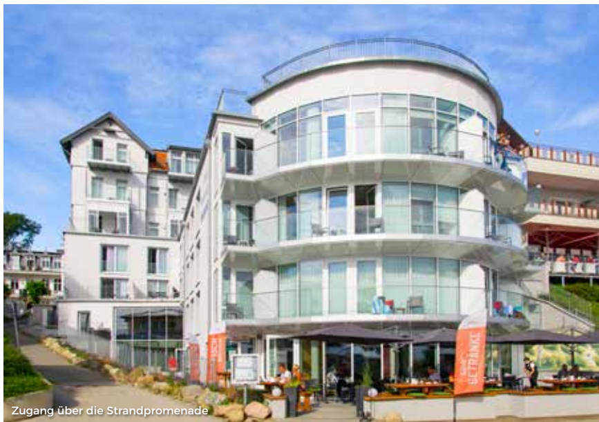
Zugang über die Strandpromenade